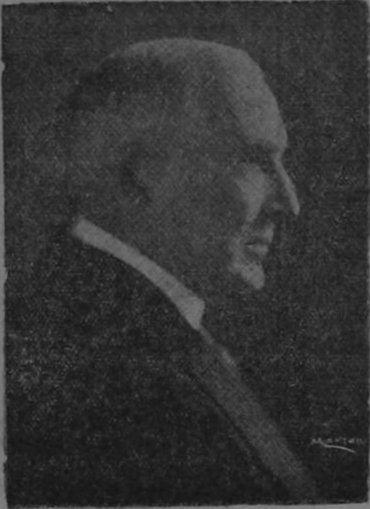
WARREN G. HARDING

Presidente de los Estados Unidos de Norte América