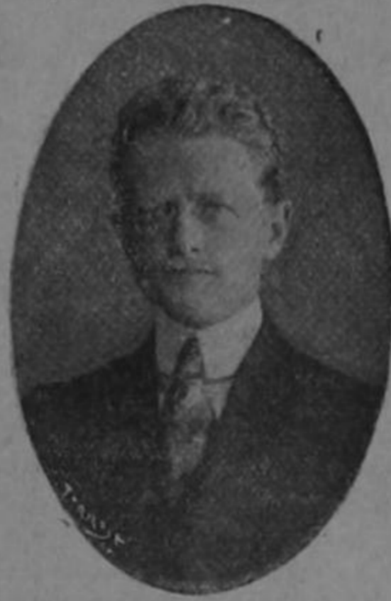
WALTER C. THURSTON

Presidente de los Estados Unidos de Norte América